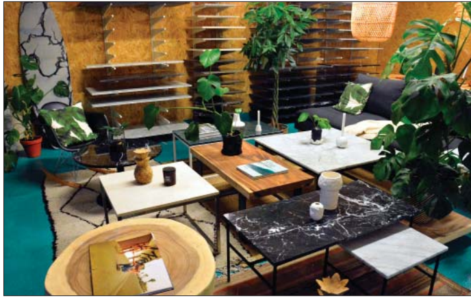
UNIKT: Eit lite utval av borda til By Bjørkheim. Både treplatene frå Bali og marmorplatene frå Italia blir kombinert med ståunderstell laga i Oslo. Ingen bord er heilt like.